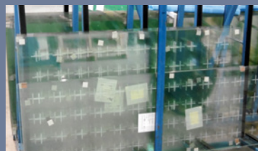
Ces verres Righetti orneront l'intérieur du plus grand paquebot au monde.